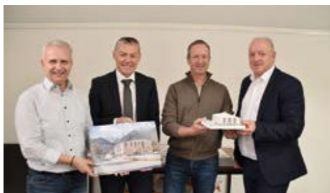
Präsentation des Siegerprojekts für den FinanzRaum Stubai

Die Bargeldversorgung in der Gemeinde Mieders ist uns sehr wichtig! Es steht Ihnen im Gemeindehaus Mieders, Dorfstraße 17, ein SB-Bereich zur Verfügung, wo die Bargeldbehebung, der Ausdruck Ihrer Kontoauszüge sowie die Abgabe Ihrer Überweisungen möglich sind.