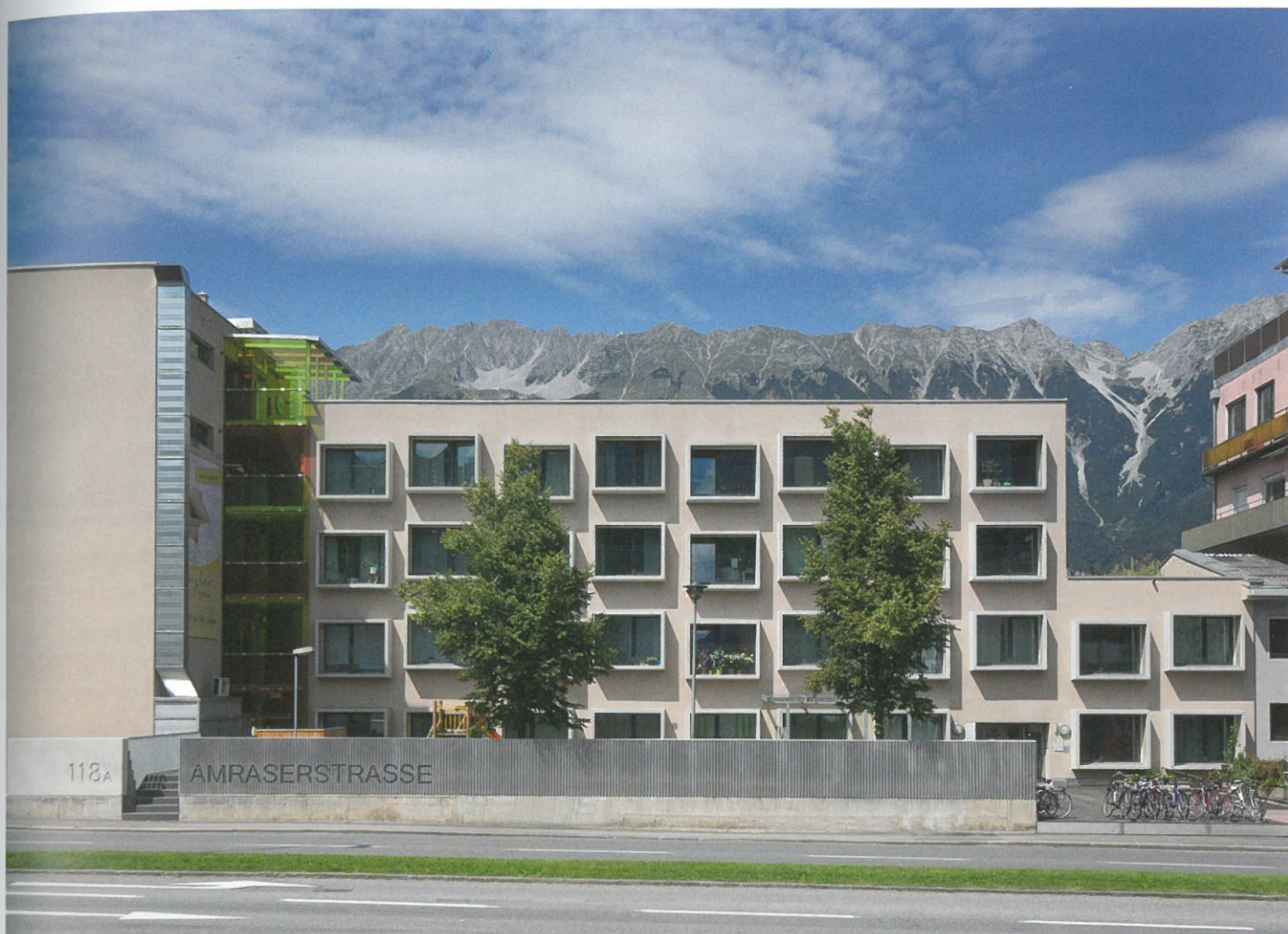
Sieger Wohnbau: Amraserstrasse 118 in Innsbruck von U1architektur